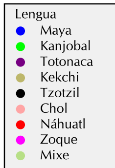
Mapa B.26. Quintana Roo: localidades indígenas* con más de dos viviendas según lengua indígena predominante, 2000